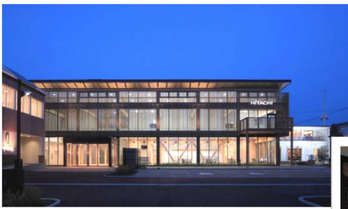
【日立ライフひたちなか支店外観】